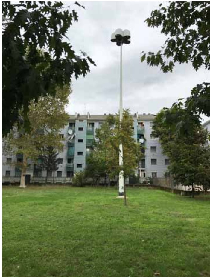
2. Veduta di una delle torri faro da eliminare

Un'ulteriore indicazione riguarda l'illuminazione pubblica ed il fatto che sull'intero lotto sono presenti 5 torri faro attualmente funzionanti. L'input progettuale è quello di rimuovere le due torri presenti all'interno della Perimetrazione 1 e di rimpiazzarle con un sistema di illuminazione parimenti efficace, ma rapportato maggiormente ad una "scala urbana"; mentre le tre torri all'interno della Perimetrazione 2 dovranno essere mantenute ed eventualmente potenziate da un sistema integrativo con corpi illuminanti posati su pali più bassi. Si veda nello specifico l'elaborato 3.4- Planimetria dei sottoservizi .