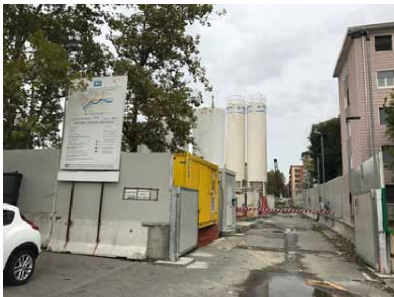
7. Veduta del cantiere della futura stazione Gelsomini sulla linea metropolitana M4

Per le valutazioni relative all'accessibilità del lotto si segnalano i lavori in corso per la realizzazione della futura stazione "Gelsomini" della Linea Metropolitana M4, che sorgerà all'incrocio fra Via Lorenteggio e Via Primaticcio e che sarà un valore aggiunto all'intero quartiere, oltre che un nodo determinante per raggiungere la Nuova Biblioteca dal resto della città.