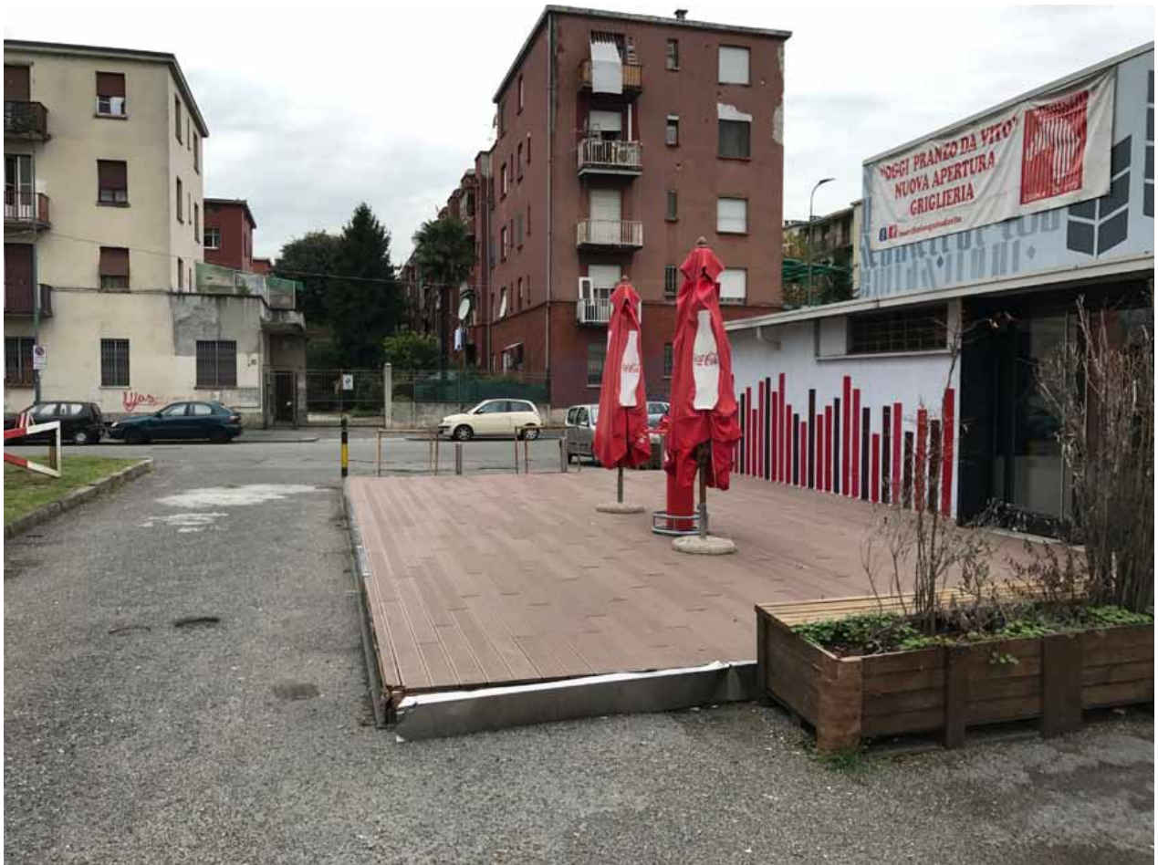
3. Veduta della pedana adiacente il mercato coperto

La progettazione dovrà tenere conto della connessione tra la futura biblioteca e gli spazi/edifici pubblici, compreso il mercato coperto che si estende verso l'esterno attraverso una pedana (ideata dal Gruppo di Lavoro G124 – Renzo Piano) realizzata con l'obiettivo di creare una continuità tra spazio interno commerciale e spazio esterno e valorizzandone il fronte verso il parco. In questa ottica di sviluppo partecipativo è doveroso segnalare che il mercato ospita, non solo attività commerciali ma, anche associazioni culturali con propri spazi dedicati.