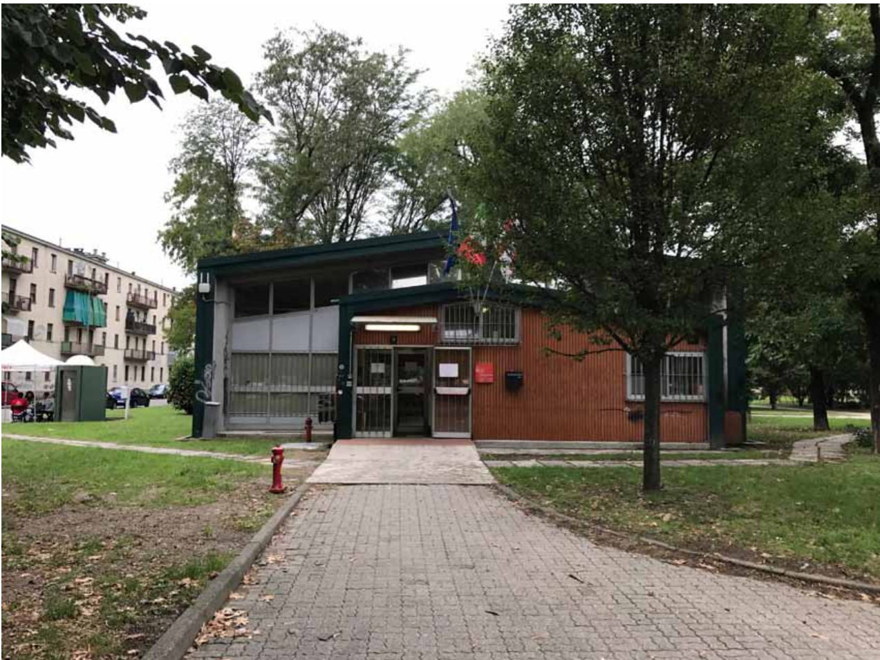
4. Veduta frontale della biblioteca del Quartiere Lorenteggio

Le chiusure trasparenti delle due facciate contrapposte erano realizzate mediante serramenti in legno e alluminio. L'impianto architettonico conserva i suoi caratteri originali; la facciata a Sud, soggetta a irraggiamento diretto, presenta superfici vetrate di minori dimensioni, risultanti tra i due volumi architettonici; la facciata Nord, dove la luce arriva in maniera indiretta, è invece ampia e priva di frangisole, affacciata direttamente sul giardino di pertinenza. Nel 2012, a seguito di un intervento di bonifica dall'amianto, l'edificio ha subito diverse modifiche, tra cui la sostituzione dei serramenti del fronte nord. Sono inoltre stati fatti interventi successivi sugli impianti ma senza un progetto coerente. L'edificio, i cui arredi interni sono stati nel tempo sostituiti, mantiene un'articolazione interna non dissimile rispetto a quella originaria. Attualmente risulta ampiamente sottodimensionato rispetto alle esigenze ed è del tutto insufficiente per le funzioni che dovrebbe ospitare e i servizi che dovrebbe erogare.