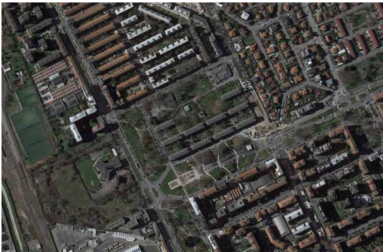
1. Veduta aerea dell'area oggetto del Concorso

La descrizione dettagliata e tutte le informazioni relative al contesto urbano in cui andrà inserito l'intervento sono esplicitate in maniera dettagliata all'interno del documento Masterplan-Programma di Sviluppo Urbano e Sostenibile, Quartiere Lorenteggio allegato al presente Bando e parte integrante dell'Accordo di Programma.