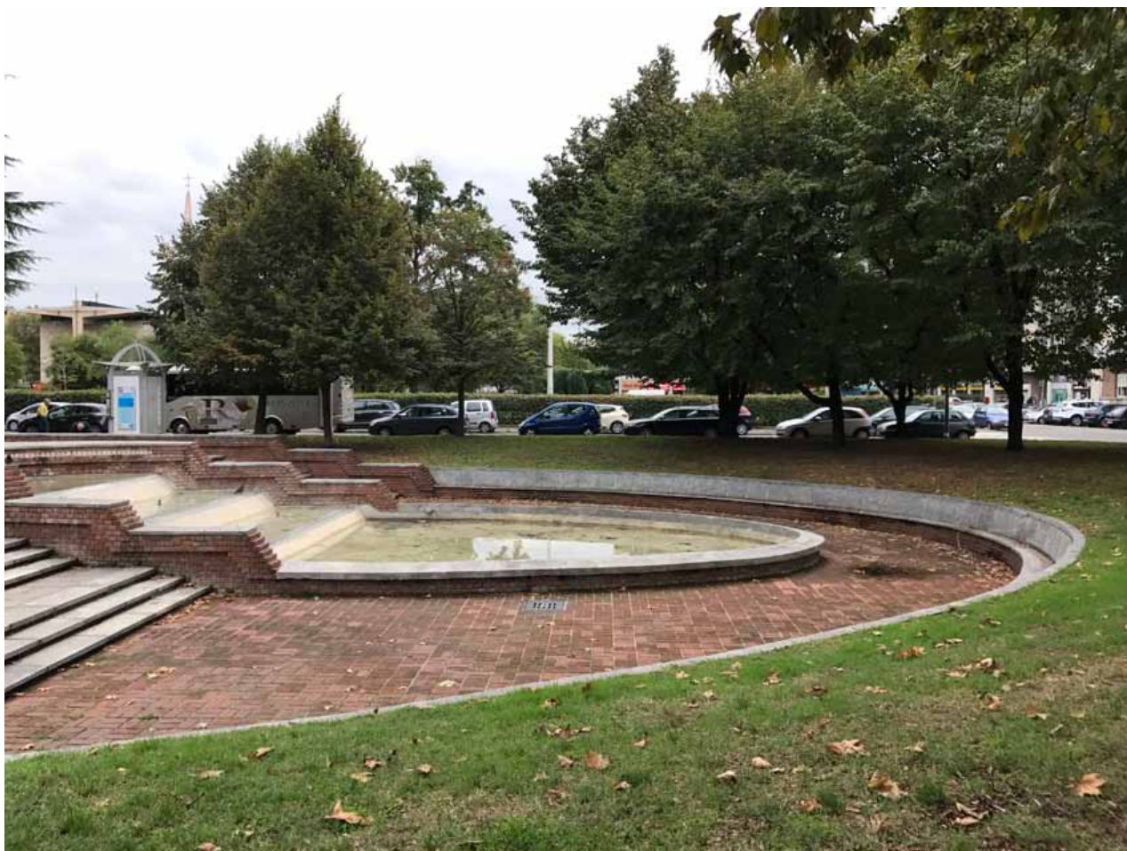
6. Veduta della fontana / anfiteatro

Per le valutazioni relative all'accessibilità del lotto si segnalano i lavori in corso per la realizzazione della futura stazione "Gelsomini" della Linea Metropolitana M4, che sorgerà all'incrocio fra Via Lorenteggio e Via Primaticcio e che sarà un valore aggiunto all'intero quartiere, oltre che un nodo determinante per raggiungere la Nuova Biblioteca dal resto della città.