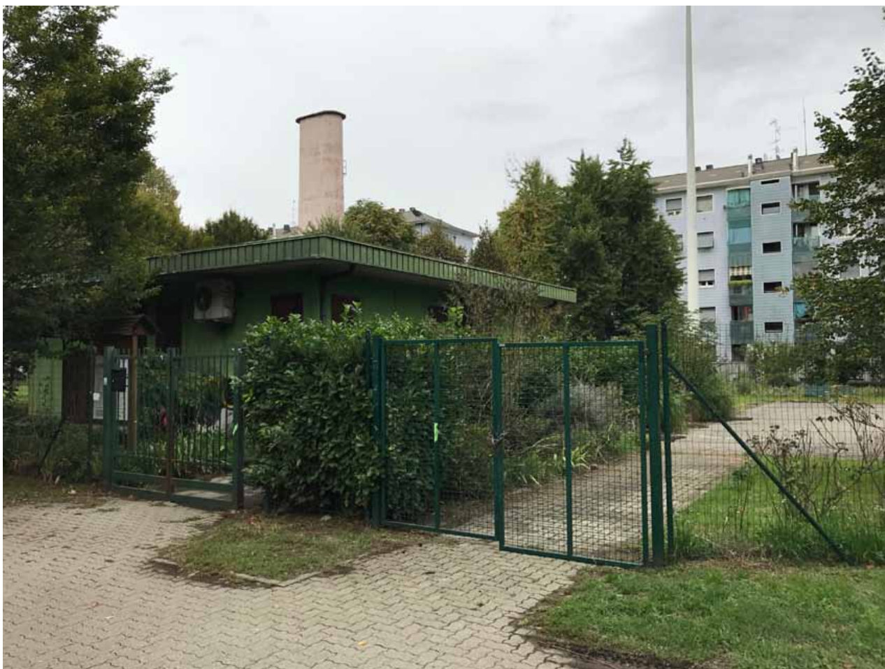
5. Veduta della “Casetta Verde” che dovrà essere demolita dopo l’insediamento della Nuova Biblioteca

Si evidenzia inoltre nel limite sud del lotto di Perimetrazione 2 , la presenza di una fontana/anfiteatro in pietra e laterizio dell’Arch. Antonello Vincenti realizzata negli anni 1950/60, il cui segno architettonico caratterizza fortemente la zona e che dovrà essere conservata.